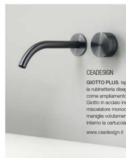
CEADESIGN GIOTTO PLUS. Ispirata alla forma pura del cerchio, la rubinetteria disegnata da Natalino Malasorti come ampliamento di gamma della collezione Giotto in acciaio inossidabile AISI 316L è dotata di miscelatore monocomando; si presenta con una maniglia volutamente generosa, che ospita al suo interno la cartuccia miscelatrice. www.ceadesign.it