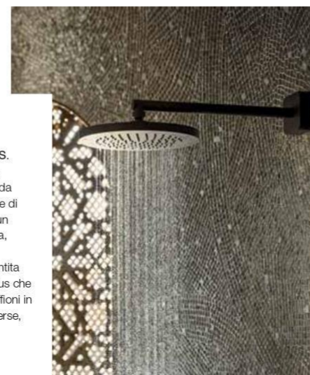
AXOR CONSCIOUS SHOWERS. Per rendere la doccia un rituale sostenibile, l'azienda ha sviluppato la collezione di soffioni caratterizzati da un ridotto consumo di acqua, da 6 fino a 12 l/min. La personalizzazione è garantita dal servizio Axor FinishPlus che permette di ottenere i soffioni in oltre dieci colorazioni diverse, lucide o spazzolate. www.axor-design.com

Una selezione ragionata di arredi, accessori, materiali e soluzioni dal dettaglio impeccabile. Completamente personalizzabili in termini di finiture, dimensioni e combinazioni, coniugano estetica e funzionalità con le esigenze specifiche di spazi progettati per generare comfort e benessere.