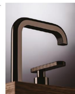
Foto in apertura MINA I colori della nuova palette CeraMina alternano tinte neutre a nuance intense e luminose, creando profondità e riflessi tra le forme arrotondate dei rubinetti. Qui declinati nel brillante Golden Yellow

1. CERDESIGN Bordi smussati, forme aggraziate e una bocca di erogazione lineare e insolitamente sottile compongono la serie Ayla, nata dalla mano inconfondibile dello studio Yabu Pushelberg 2. ANTONIOLUPI Un taglio netto ma allo stesso tempo misurato. Disegnata da AL Studio, Essentia combina le geometrie pure del cilindro alle linee squadrate della leva che vi si innesta con un gesto dirimpante