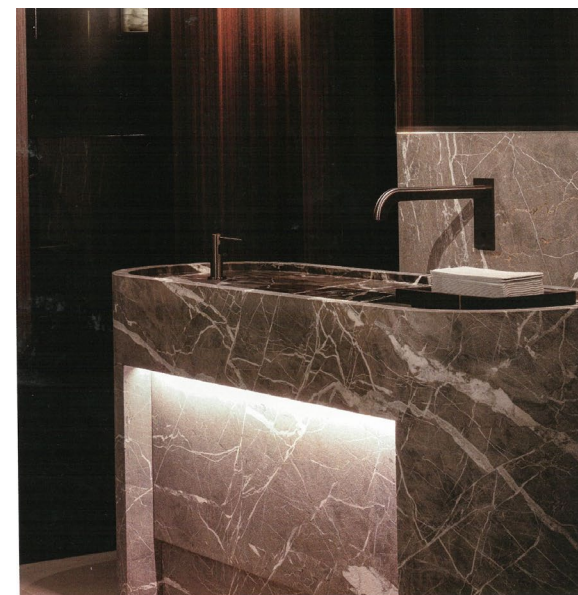
A sinistra, la coerenza formale e le linee eleganti ed ergonomiche della collezione Sixty realizzata da Ceadesign all'interno dell'Hotel La Réserve in Belgio. Sotto, la hall dell'hotel. Nella pagina accanto in alto, una salle de bain all'interno dell'Hotel Lutetia: la rubinetteria bespoke, disegnata appositamente dal progettista, Jean-Michel Wilmotte, è caratterizzata da linee classicheggianti che rievocano il passato storico dell'edificio. In basso, la sala bar dell'Hotel Lutetia.