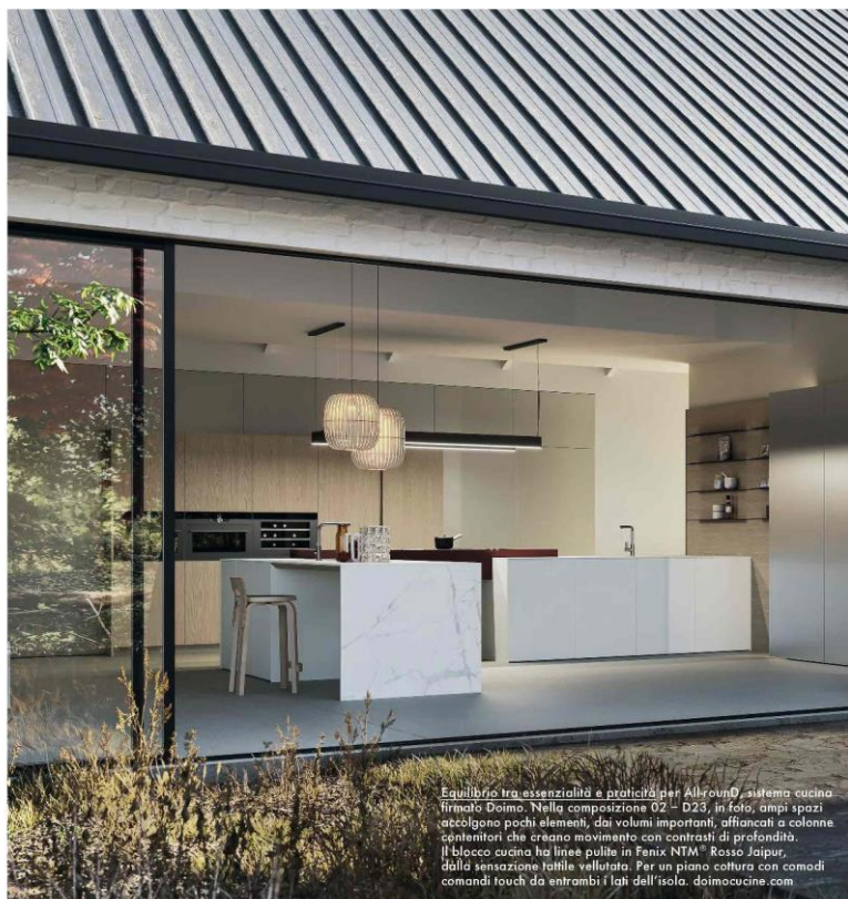
Equilibrio tra essenzialità e praticità per Allround, sistema cucina firmato Doimo. Nella composizione 02 - D23, in foto, ampi spazi accolgono pochi elementi, dai volumi importanti, affiancati a colonne contenitori che creano movimento con contrasti di profondità. Il blocco cucina ha linee pulite in Fenix NTM Rosso Jaipur, dalla sensazione tattile vellutata. Per un piano cottura con comodi comandi touch da entrambi i lati dell'isola. doimocucine.com