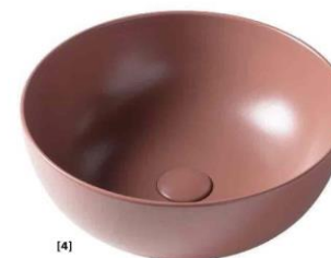
1. Dalla collaborazione tra Devon&Devon e Marcel Wanders Studio nasce Secret Gardens. Una linea di prodotti rivestiti da una pellicola vinilica con motivi decorativi. Come il vanity table Blossom, in foto, disponibile in sette pattern. devon-devon.com 2. Underground è un contenitore formato da due elementi, uno rotondo in marmo e un altro sovrapponibile in legno. Disegnato da Attila Veress per luce di Carrara, in due misure. lucedicarrara.it 3. In acciaio inox con finitura bronzo satinato la rubinetteria Lutezia di Cea. Un progetto di Jean-Michel Wilmotte nato per il celebre hotel Lutetia di Parigi e ora a catalogo del brand. ceadesign.it 4. Uva e menta sono le nuovissime tonalità ideate da Ceramica Fiaminica per alcune delle sue collezioni. In foto, il lavabo da appoggio App nella nuance uva. ceramicafiaminica.it