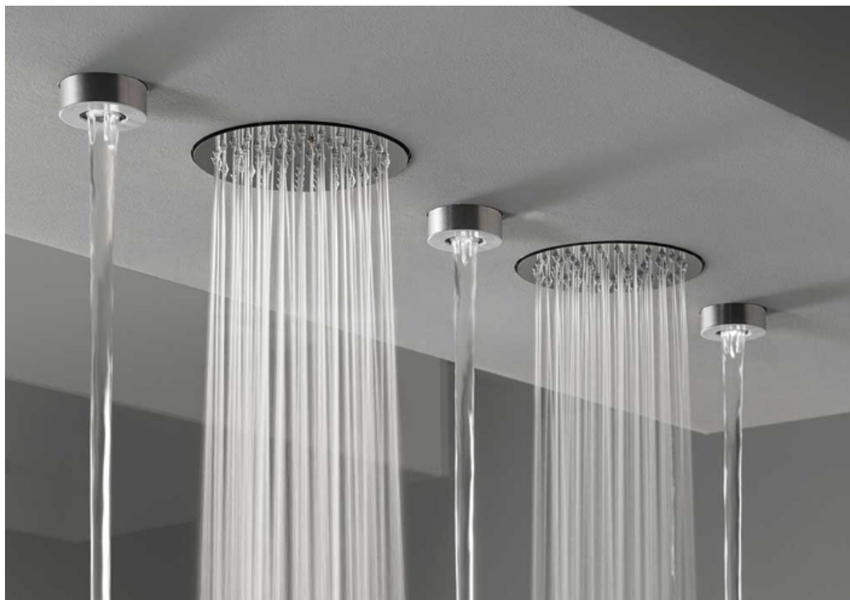
Soffioni a soffitto da incasso Free Ideas by Cea Design

La straordinaria flessibilità di composizione e di applicazione rende la collezione in grado di soddisfare qualsiasi tipo di esigenza e di benessere. Inoltre, tutte le erogazioni della collezione Free Ideas come tutti i prodotti Cea perseguono il principio di risparmio idrico. Prezzo: composizione ad incasso € 2.665 comprensivo di IVA e delle parti di incasso