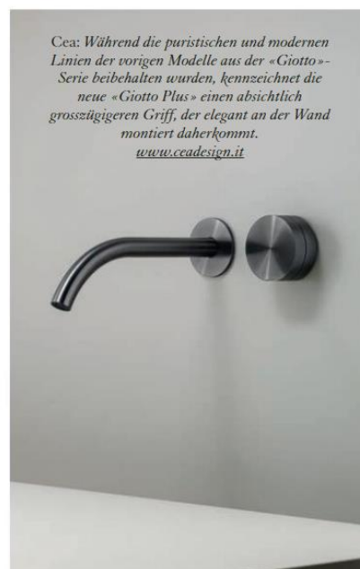
Cea: Während die puristischen und modernen Linien der vorigen Modelle aus der «Giotto»-Serie beibehalten wurden, kennzeichnet die neue «Giotto Plus» einen absichtlich grosszügigeren Griff, der elegant an der Wand montiert daherkommt. www.ccadesign.it