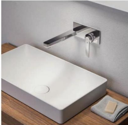
KWC: Seit 40 Jahren begeistert «KWC DOMO» bereits. Dabei wurde die Armaturenserie immer wieder dem neusten Stand der Technik angepasst und im Design aktualisiert. Die aktuellste Generation zeigt sich in feiner Silhouette und mit geringerem Gesamtdurchmesser. www.kwc.de